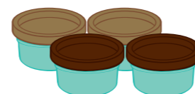
4 cajas de mezcla